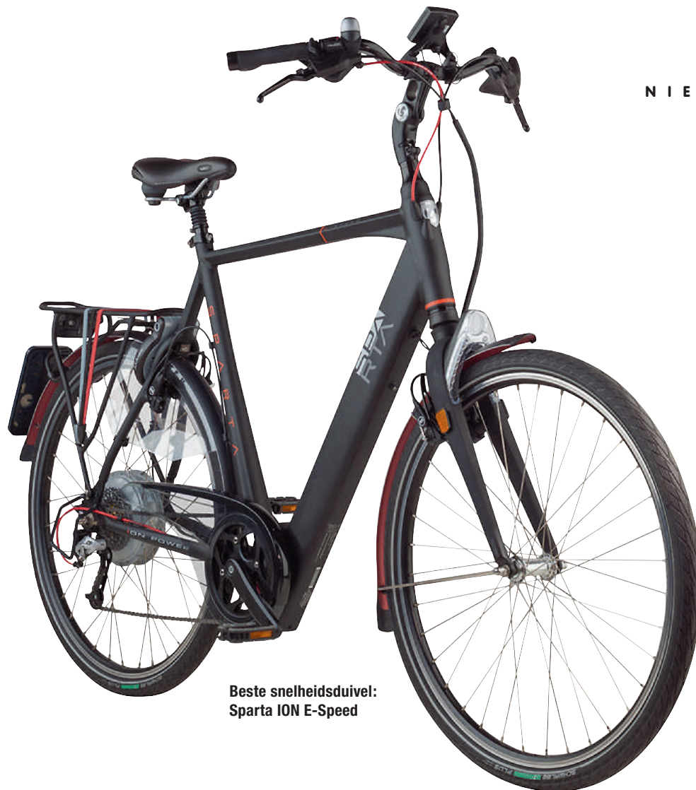
Beste snelheidsduivel: Sparta ION E-Speed

"De bewezen ION technologie zorgt voor een zeer gelijkmatige ondersteuning en het motorgeluid is minimaal", aldus diezelfde jury.