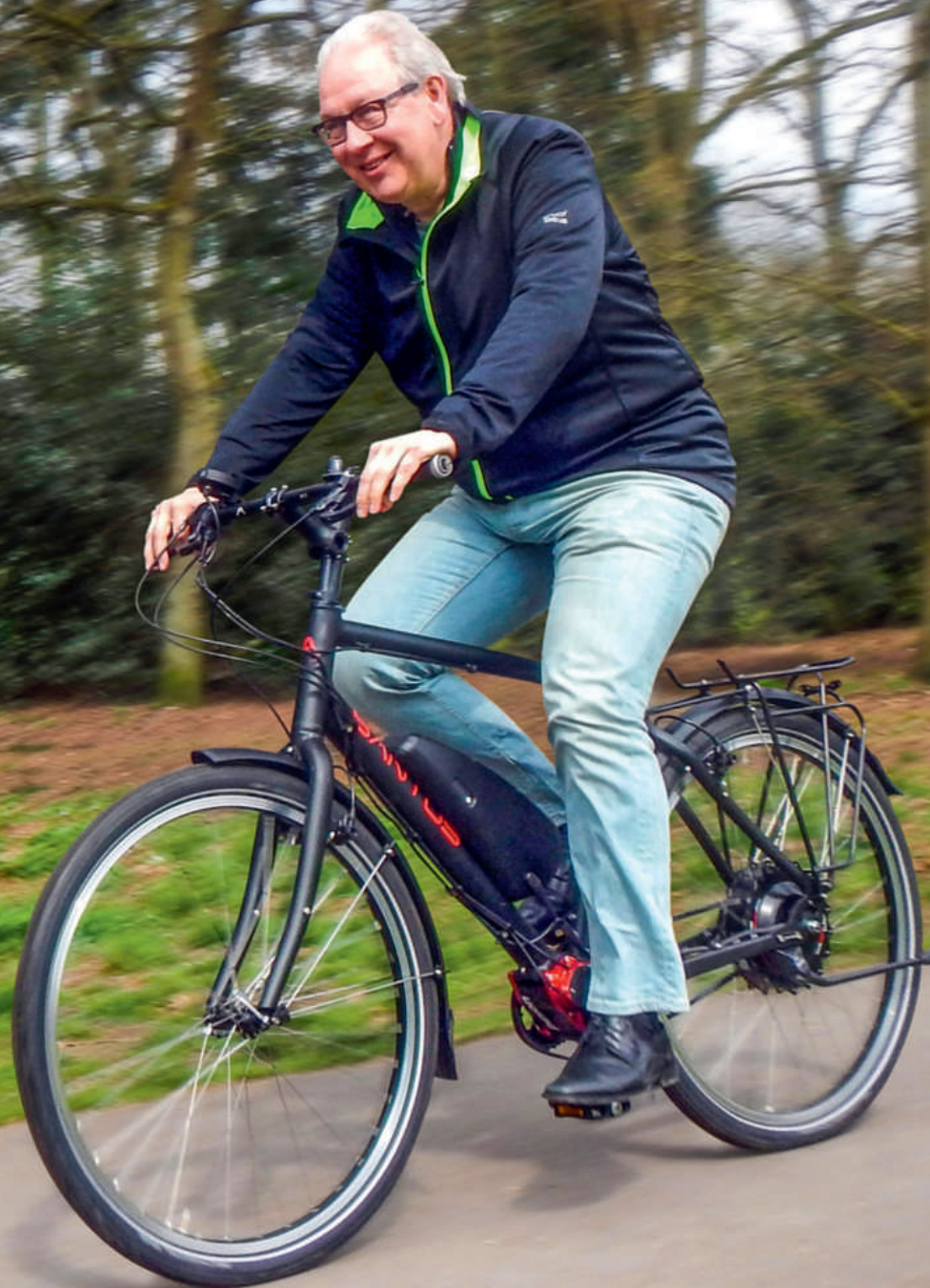
Relaxed rammen. De Santos Travel E-Lite gaat snel zonder een druppel zweet.