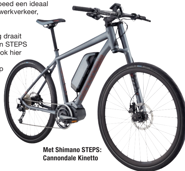
Met Shimano STEPS: Cannondale Kinetto