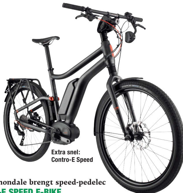
Extra snel: Contro-E Speed