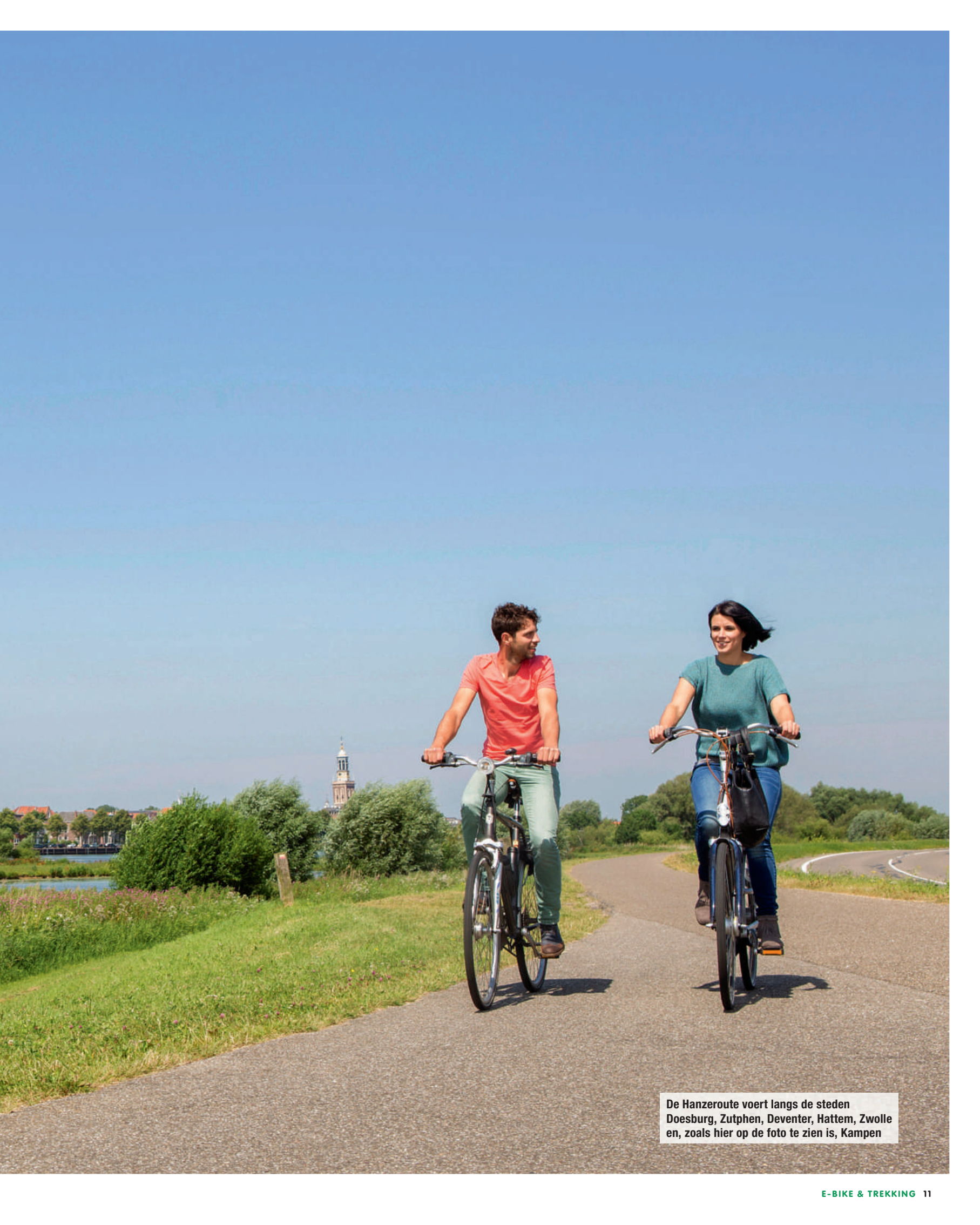
De Hanzeroute voert langs de steden Doesburg, Zutphen, Deventer, Hattem, Zwolle en, zoals hier op de foto te zien is, Kampen