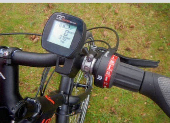
De Pinion P1.9 versnellingsbak biedt meer dan genoeg versnellingen. Het hoge motorkoppel maakt je schakellui en het zou met minder verzetten kunnen.