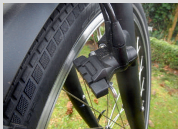
De blokjes van de perfect remmende Magura Firmtech remmen zijn letterlijk in een handomdraai en zonder gereedschap te vervangen.