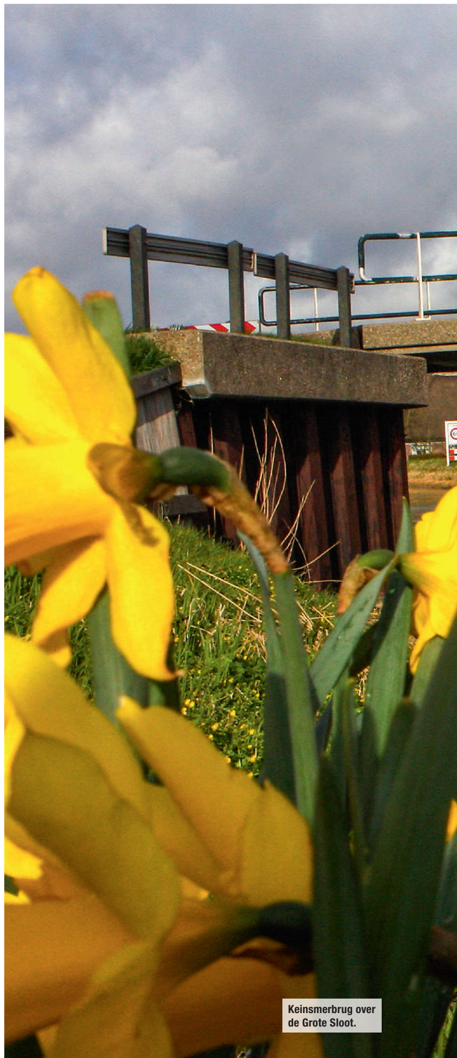
Keinsmerbrug over de Grote Sloot.

De Polder Eenmaal overgestoken is het fascinerend om vast te stellen hoe snel je hier van 'decor' kunt veranderen. Was de stad daarnet nog uitdrukkelijk aanwezig, nu wanen we ons gelijk in heel andere sferen. Daar helpt het smalle, kronkelende landweggetje ook flink aan mee. We passeren ook gelijk een echte Noord-Hollandse stolp-boerderij, het boerderij-type dat hier het >>